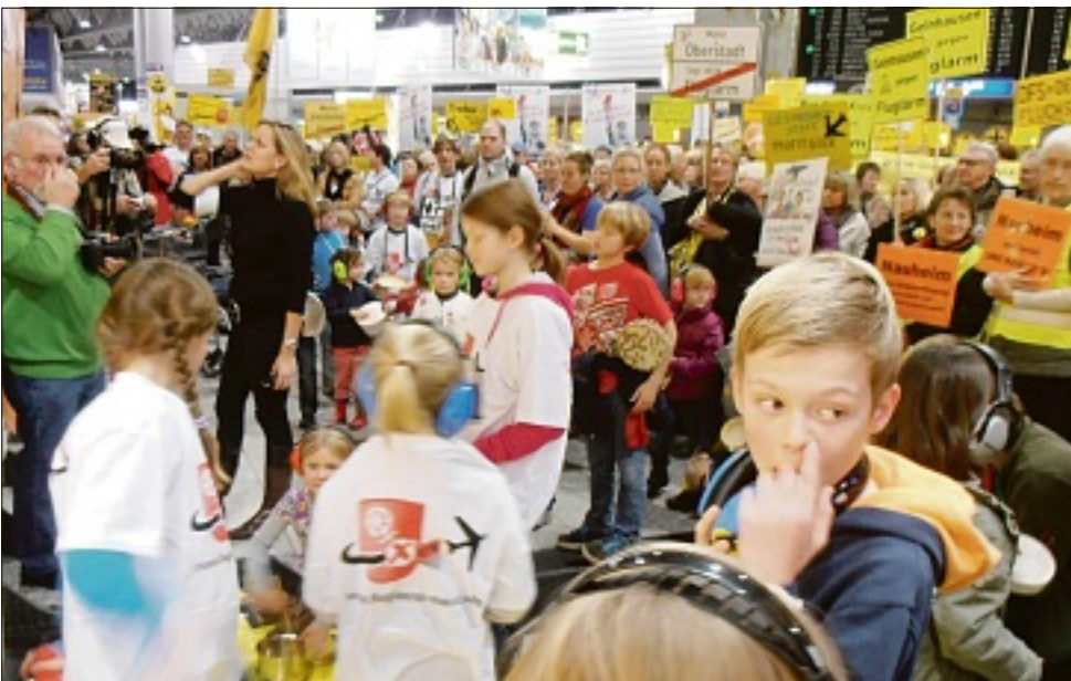
Kinder und Erwachsene üben das Trommeln. Die große Halle des Terminal 1 war erfüllt von einem lautstarken dreistimmigen „Kanon“, erzeugt von hell, mittel und tief klingenden „Instrumenten“.

Harmonisch und laut – 42. Demo im Terminal 1 des Frankfurter Flughafens