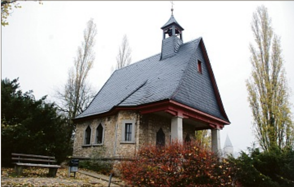
Den Deutschen in der französischen Besatzungszone war es nach dem Ersten Weltkrieg nicht erlaubt, Kriegerdenkmäler für ihre gefallenen Soldaten zu errichten. Aus diesem Grund entschieden sich die Flörsheimer für den Bau der Kriegergedächtniskapelle.

Vortrag: Flörsheim und Frankreich verbindet eine lange Geschichte