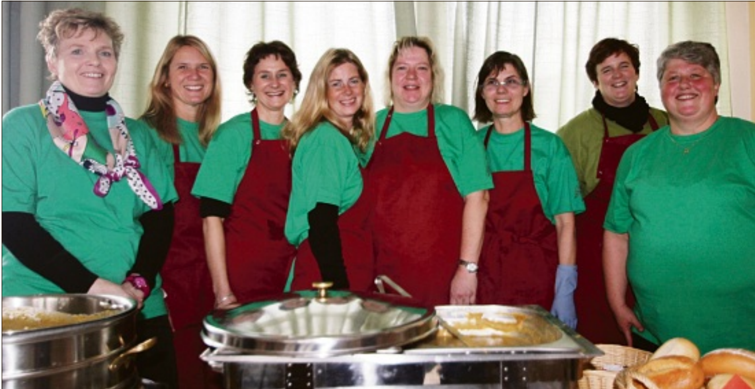
Das „Erbsensuppen-Team“ der Weilbacher Pfarrgemeinde: Seit diesem Jahr auch gut erkennbar an ihrem neuen „Dresscode“, dem erbsengrünen T-Shirt und der dunkelroten Schürze.

Die Einnahmen des diesjährigen Erbsensuppensonntags gehen an regionalen Verein