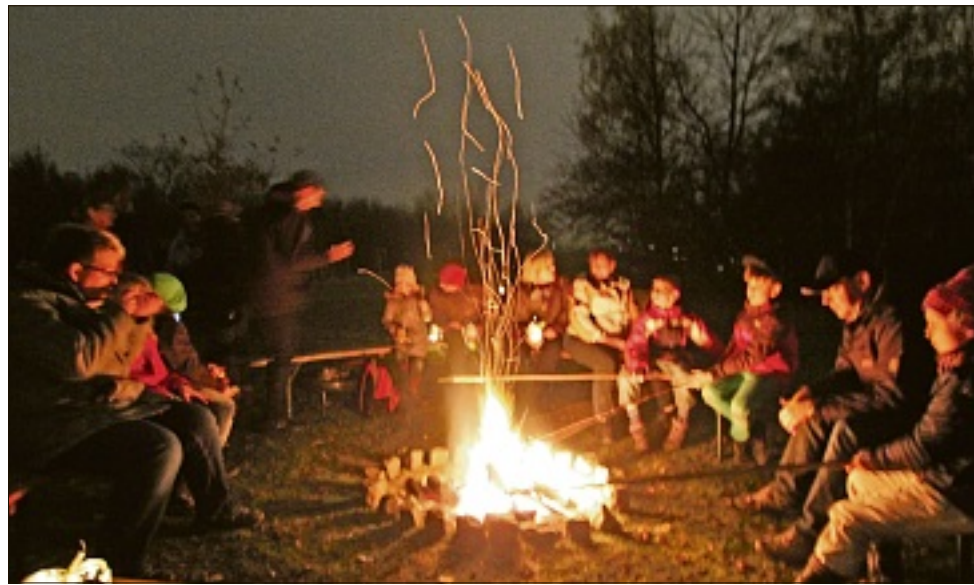
Geheimnisvoll leuchteten die Funken sprühenden Lagerfeuer im stockdunklen Regionalpark-Gelände, lecker duftete das Stockbrot.

Wagen Holz an ihn abzugeben, sonst wollte er ihm den Kopf runter machen“, weiß Svenja noch, „aber der Holzknecht hatte eine Frau und fünf Kinder und konnte einfach nicht so viel an den König abgeben. Dann hat er in der Nacht, bevor der König alles holen wollte, noch einmal mit seiner Familie zusammen am Lagerfeuer gesessen, weil sie dachten, es sei ihre letzte Nacht zusammen und sie haben sich viele Geschichten erzählt – und dann ist der König in dieser Nacht gestorben, also musste der Holzknecht dann nur noch vier Bretter für den Sarg hergeben und sein Kopf blieb drauf.“ Ihre Mutter ergänzte: „Ja, und dabei haben sie gemerkt, dass dies die schönste Nacht für die Familie überhaupt war, weil sie so lange zusammengesessen und miteinander gesprochen hatten!“