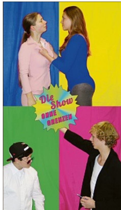
Die Satire „Die Show ohne Grenzen“ stellt auf überspitzte Weise die Scheinwelt im Fernsehen dar.

Ansonsten erwartet die Besucher wieder ein abwechslungsreiches Programm und interessante Stände, die einen Besuch des Marktes lohnenswert machen.