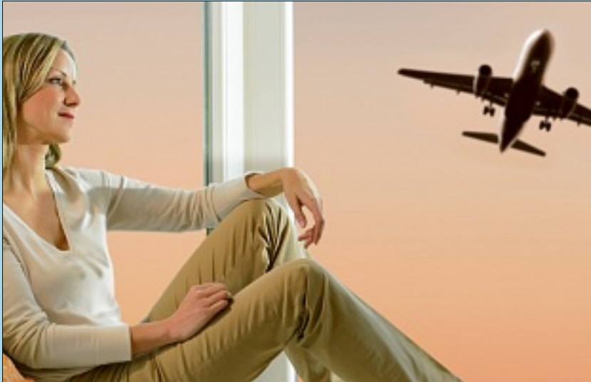
Erhöhter Schallschutz, Einbruchschutz und Energieeinsparung zeichnen die aktuellen Fenster aus.

Schallschutz, Einbruchschutz, Energieeinsparung