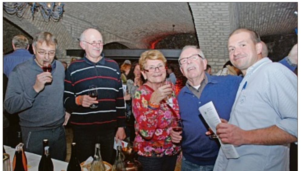
WeinkulturPur: 154 Weine, Sekte und Seccos durften am Wochenende in der alten Sektellerei Falkenberg probiert werden.