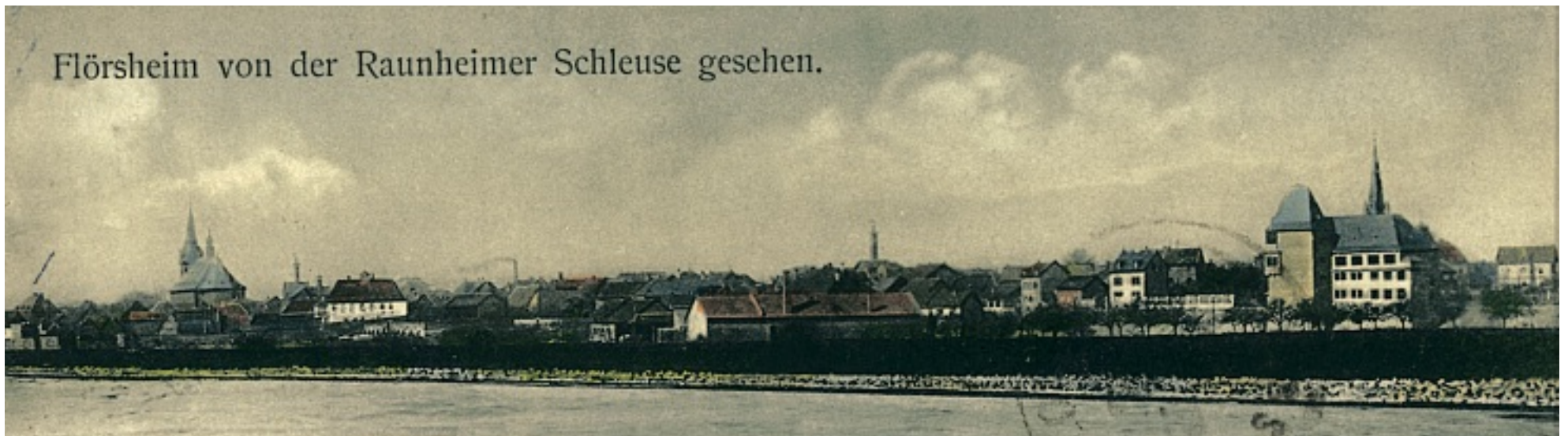
Die Riedschule vom Main her