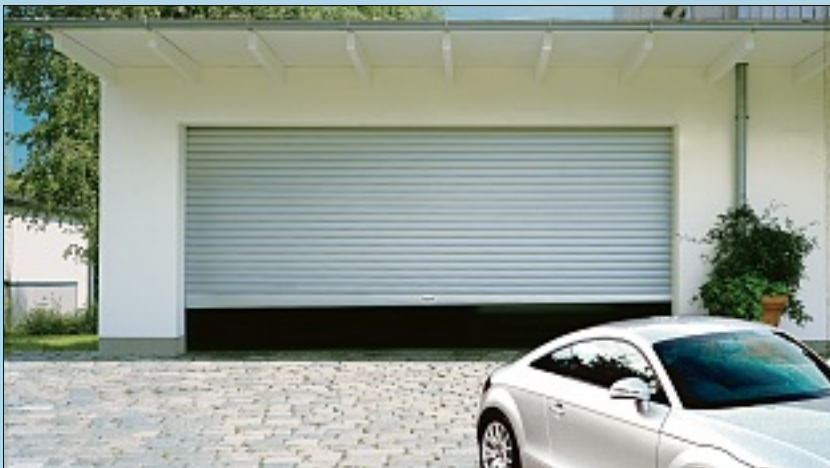
Komfortabel funk(fern)gesteuert, sicher und beste Raumaussparung sind einige Vorteile der neuen Garagentorgeneration.

Die Garagentore der neuen Generation sind ein „Raumwunder“. Sie schaffen mehr Platz vor und in der Garage. Deckenlaufotore empfehlen sich für enge und schmale Garagen mit wenig oder keinem Sturz, Rolltore wiederum sind geeignet für mehr Platz in der Garage, wenn ein ausreichender Sturz vorhanden ist. Die Tore sind motorisiert und können mit Funkfernsteuerung ausgestattet werden. Für mehr Sicherheit sorgt die Hochschiebesicherung, die patentierte Panzerarretierung und der automatische Stopp bei Hindernissen. Besonders empfohlen werden Aluminium-Garagentore, die extrem wartungsarm, pflegeleicht, lichtecht und witterungsbeständig sind. Diese und viele weitere Bauteile wie Rollläden, Wintergärten, Terrassendächer usw. können Sie im 1000-qm-Ausstellungszentrum der Singhoff GmbH besichtigen und sich beraten lassen. In der Robert-Koch-Straße 10-12 in Raunheim, täglich von 9 bis 18 Uhr, samstags von 9 bis 12 Uhr. Auf Wunsch kommen die Berater der Singhoff GmbH auch zu Ihnen nach Hause.