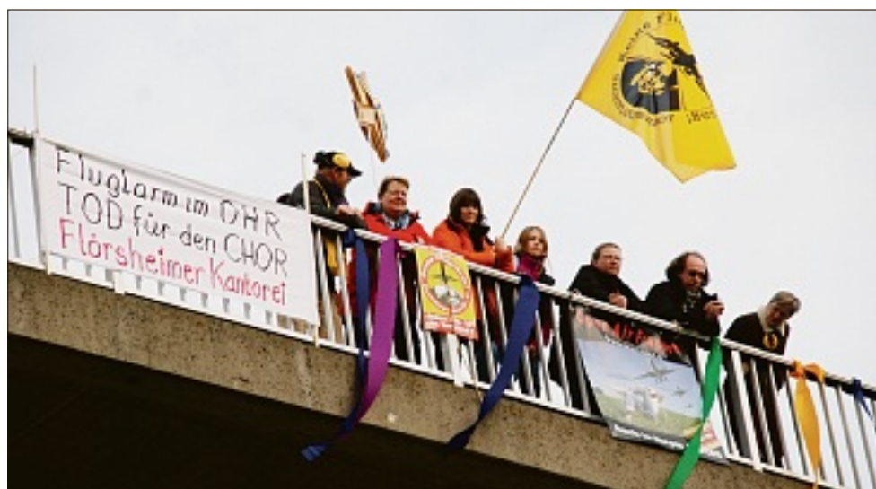
Die Demonstranten nutzten das Brückengeländer dem Motto der Protestaktion entsprechend.

In Flörsheim war es vorerst die letzte Demonstrationsaktion, man will erst nach dem Winter, sprich nach der Fastnacht, weitermachen. Im Terminal allerdings geht es auch jetzt noch weiter und am 10. Dezember wird gar die Bürgerinitiative Flörsheim-Hochheim die Montagsdemo ausrichten.