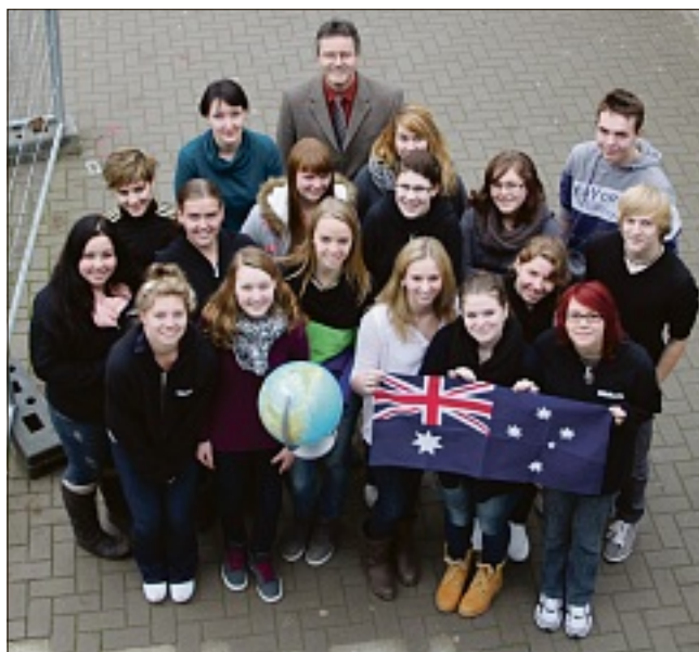
Nicht nur wegen der Sprache sind die 15- bis 17-jährigen Mädchen den weiten Weg von Australien bis nach Deutschland gereist, auch sind sie neugierig und wollen genau wissen, wie man in Deutschland so lebt.

FLÖRSHEIM (ak) – Berlin und Helgoland sind ihnen ein Begriff, Sauerkraut, Käsewurst und Bratkartoffel kennen die acht australischen Austauschschülerinnen, die zurzeit am Graf-Stauffenberg-Gymnasium (GSG) in Flörsheim zu Gast sind, schon als „typisch deutsches Essen“. Von „der deutschen Insel“ und „der Stadt“ haben sie in der Schule gehört, die deutschen „Köstlichkeiten“ haben sie in einem deutschen Restaurant in ihrer Heimatstadt Adelaide probiert. „Das Sauerkraut war nicht so lecker – aber vielleicht schmeckt es besser, wenn man es nicht im Restaurant isst“, haben sie die Hoffnung, „und wenn vielleicht 'Bacon' dran ist oder so?“ Ihr Restaurantbesuch in Adelaide gehörte zu ihrer „Vorbereitung“ auf ihren Aufenthalt in Deutschland: „Wir mussten dort alles in deutscher Sprache bestellen, wenn man was nicht richtig gesagt hat, musste man das wiederholen und hat es erst bekommen, wenn man es richtig ausgesprochen hat“, erinnern sie sich lachend.