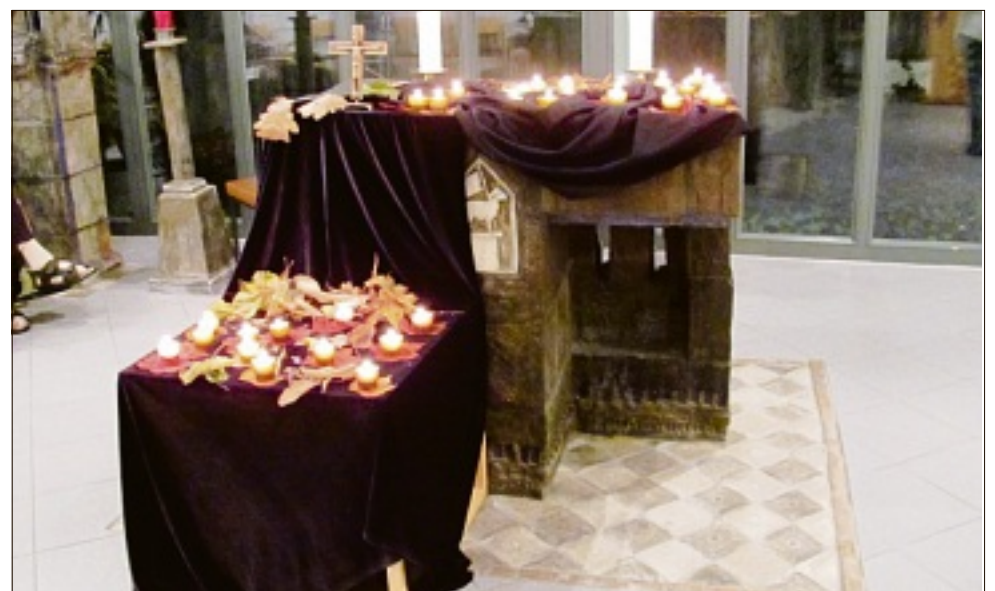
Der Altar in der Hauskapelle des Laurentius-Münch-Hauses mit den entzündeten Kerzen für die verstorbenen Bewohner.

FLÖRSHEIM (pm) – Im Laurentius-Münch-Haus findet wöchentlich ein Gottesdienst sowie monatlich eine Andacht statt.