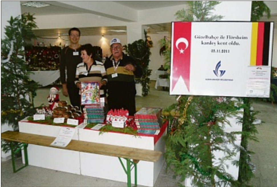
Mitglieder des Deutsch-Türkischen Freundeskreises aus Flörsheim verkauften an ihrem Stand allerhand weihnachtliche Leckereien auf dem türkischen Weihnachtsmarkt in Güzelbahçe.

Deutsch-Türkischer Freundeskreis war mit großartigem Erfolg vertreten